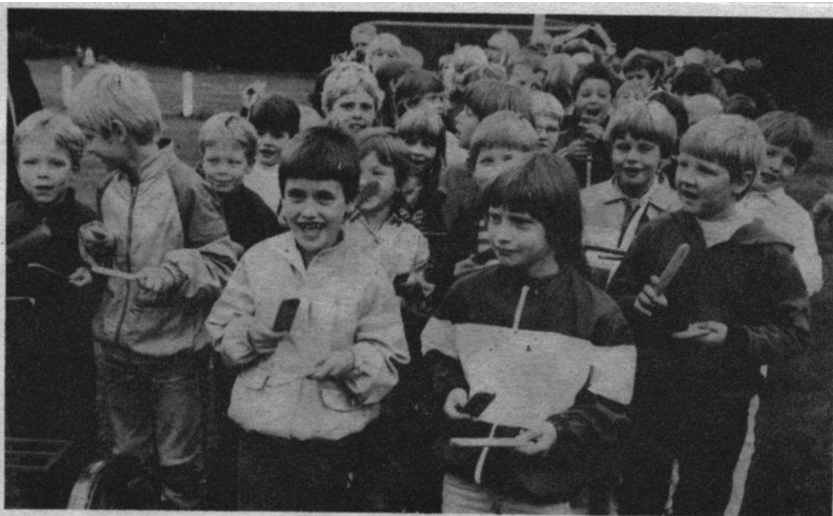
Enthousiast klepperende Harfsense schoolkinderen