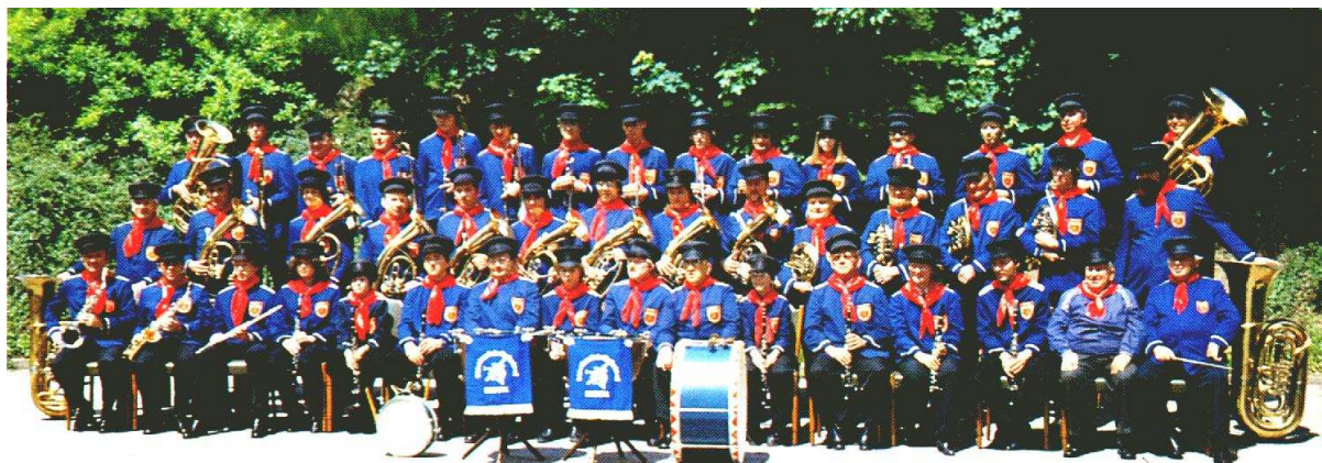
"Die Original Sauerlander Kapelle" Ennepetal

Tegen half vier togen de muzikanten van SDG gekleed in hun nieuwe uniformen (hemelsblauwe blazer, met zwarte epauletten en blanke knopen, grijze rok of pantalon met witte biezen en op het hoofd een zwarte halve kolbak) naar buiten omdat de gasten uit Duitsland de Original Sauerlander Musikanten uit Ennepetal ( waar de Canadese All Girls Band ook was geweest ) in aantocht waren.