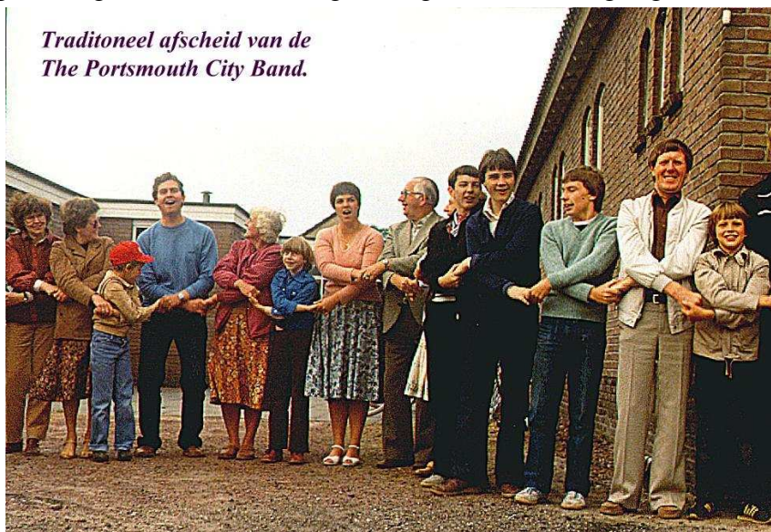
Traditioneel afscheid van de The Portsmouth City Band.

13 december 1980 was er weer een gezamenlijk Kerstconcert met de Zang en VIOS, terwijl 's Middags bij de Marijke- boom het