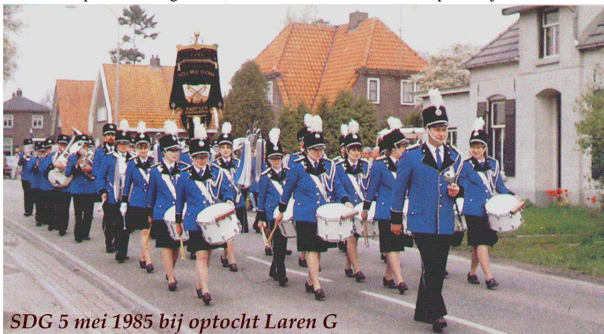
SDG 5 mei 1985 bij optocht Laren G

Daar op historische gronden, het werkterrein van S.D.G. oorspronkelijk ook Almen en