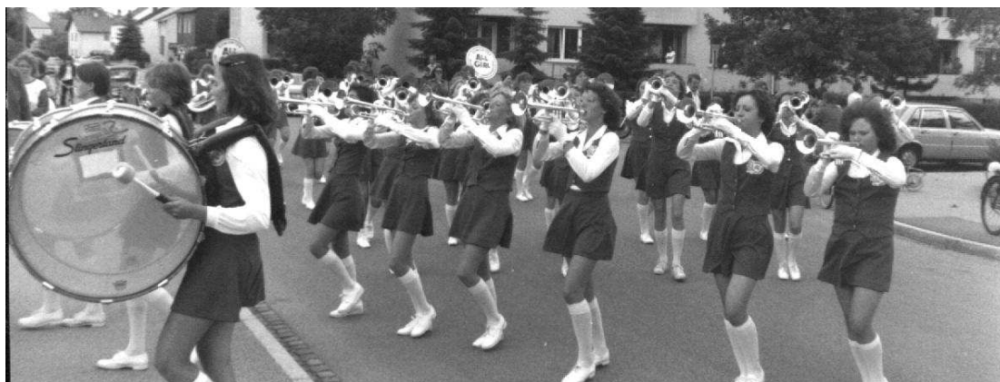
The Edmonton All Girls Marching Band hier in actie in de stad Augsburg Beieren.

Zo kon de tour worden samengesteld naar ENNEPETAL; AUGSBURG in Zuid Duitsland; FUSSEN Oostenrijk CLOPPENBURG Duitsland en KOPENHAGEN Denemarken.